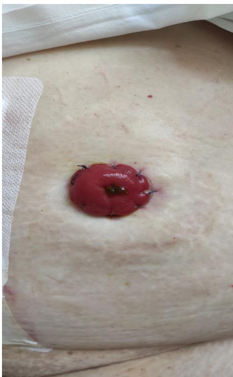
Fotoarchív autorky, fotené so súhlasom pacienta