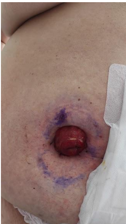
fotené so súhlasom pacienta